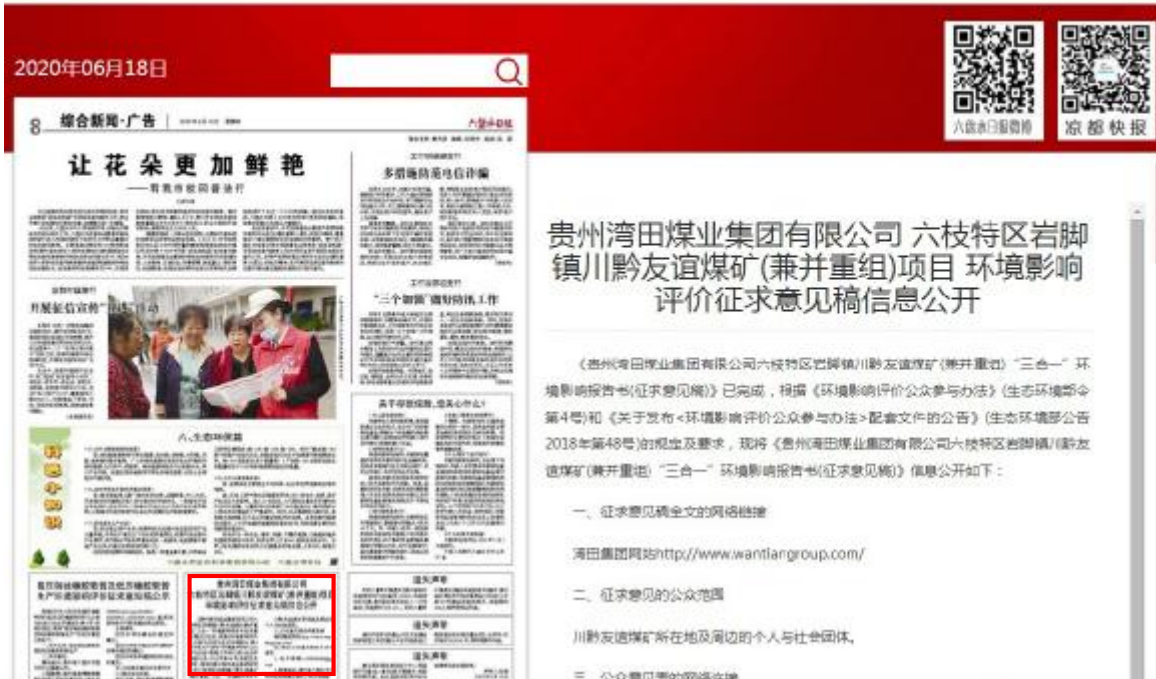
六盘水日报第二次公示