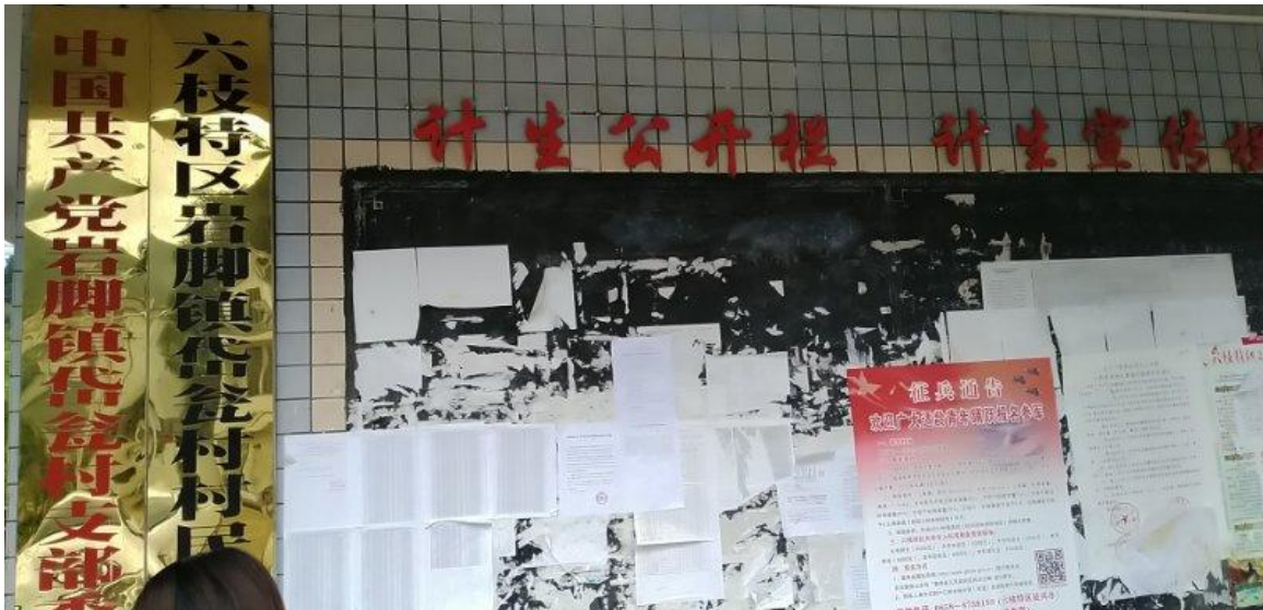
六枝特区岩脚镇岱瓮村村委张贴公示

2020年6月12日，我公司在六枝特区岩脚镇岱瓮村村委进行了张贴公示。公示日期为：2020年6月12日~2020年6月21日。