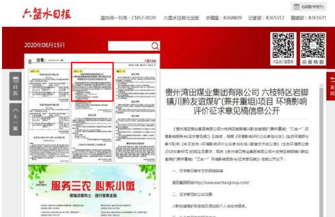
六盘水日报第一次公示

2020年6月15日、2020年6月18日,我公司分别在六盘水日报(第8版)进行了两次公示,公示期限: